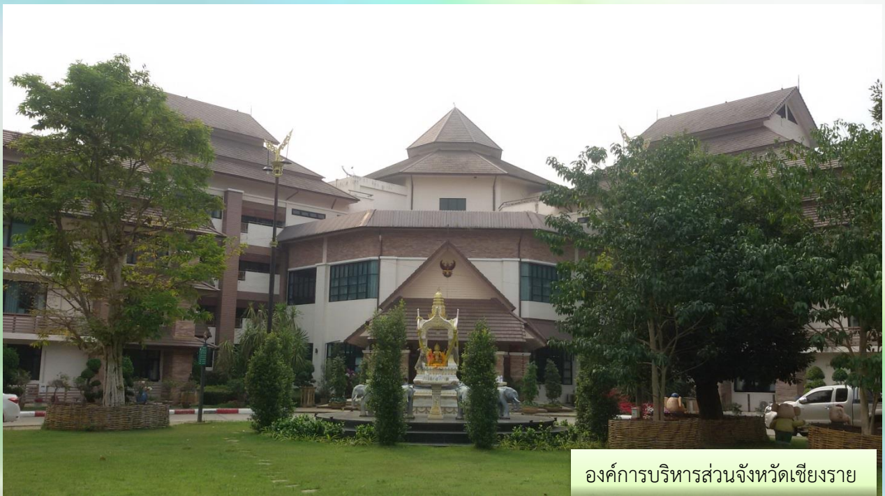
องค์การบริหารส่วนจังหวัดเชียงราย

มีหน้าที่ความรับผิดชอบเกี่ยวกับงานตรวจสอบบัญชี ทะเบียน และเอกสารที่เกี่ยวข้อง งานตรวจสอบเอกสารการรับเงิน การเก็บรักษา หลักฐานการเงิน การบัญชี การจัดเก็บรายได้ ยอดเงินทตรง ราชการคงเหลือให้ตรงตามบัญชี หลักฐาน เอกสารทางบัญชี รวมทั้งการควบคุมเอกสารทางการเงิน การใช้ และการเก็บรักษายานพาหนะให้ประหยัด และถูกต้องตามระเบียบของทางราชการ งานติดต่อประสานงาน วางแผน มอบหมายงาน ควบคุม ตรวจสอบ ให้คำปรึกษาแนะนำ ปรับปรุง แก้ไข ติดตามประเมินผล และแก้ไขปัญหาขัดข้องในการปฏิบัติงานในหน่วยงานที่รับผิดชอบ