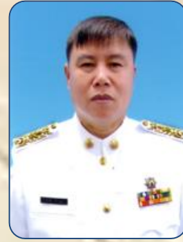
ส.ต.ต.ชมชาติ กัปปะหะ อ.แม่จัน เขต ๓