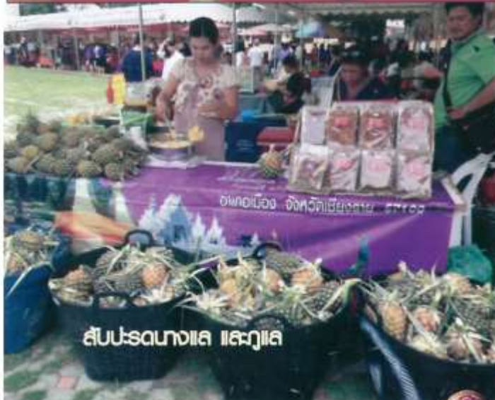
สัปดาห์ผลไม้และของดี