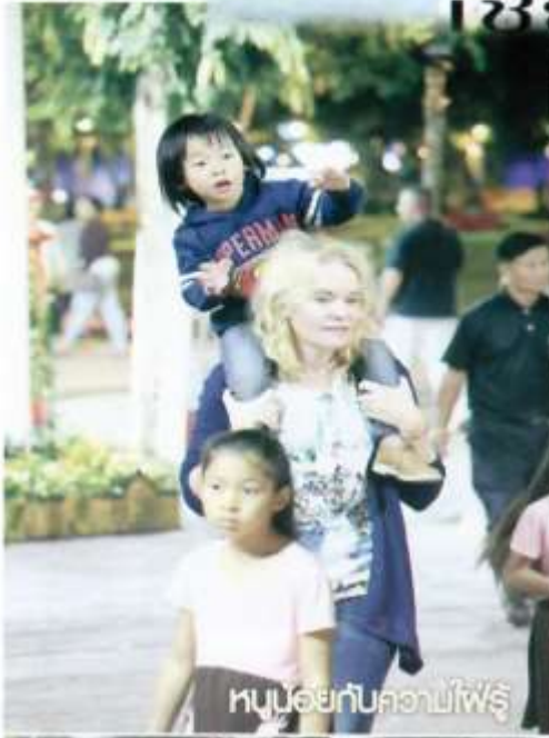
หนูน้อยกับคุณแม่โพธิ์