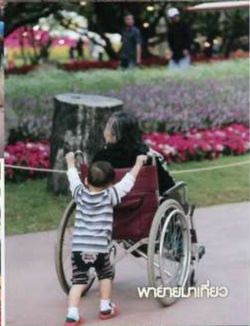
พ่อยายมาเที่ยว