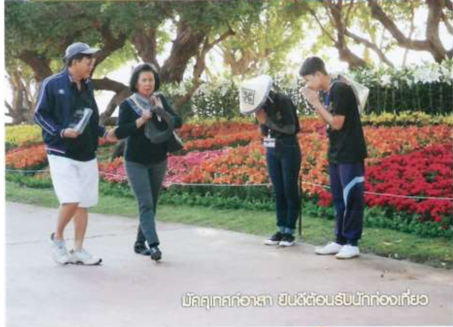
ไม้ดอกเทศกาลอาเซียน ยินดีต้อนรับนักท่องเที่ยว