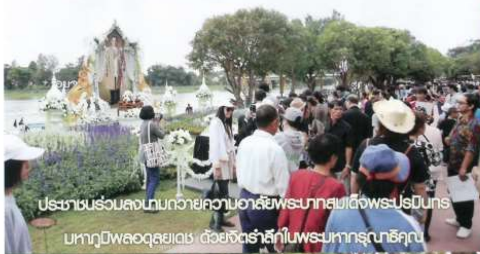
ประชาชนร่วมลงนามถวายความอาลัยพระบาทสมเด็จพระปรมินทรมหาภูมิพลอดุลยเดช ด้วยจิตสำนึกในพระมหากรุณาธิคุณ