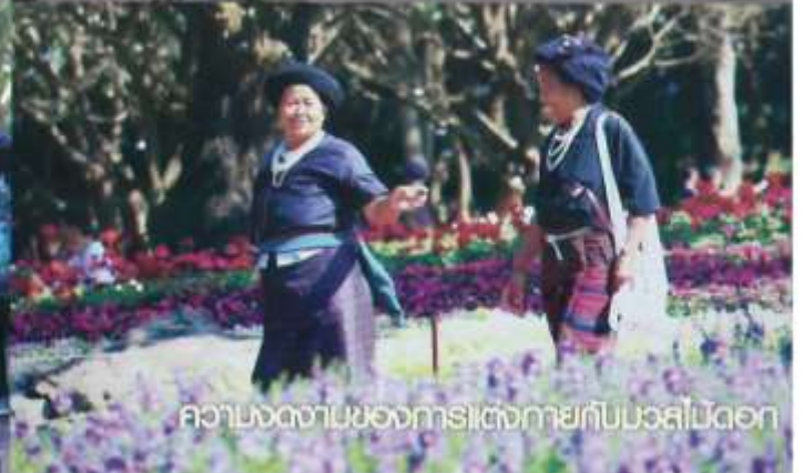
ความงดงามของการเิดงกายกับมวลสีไม้ดอก