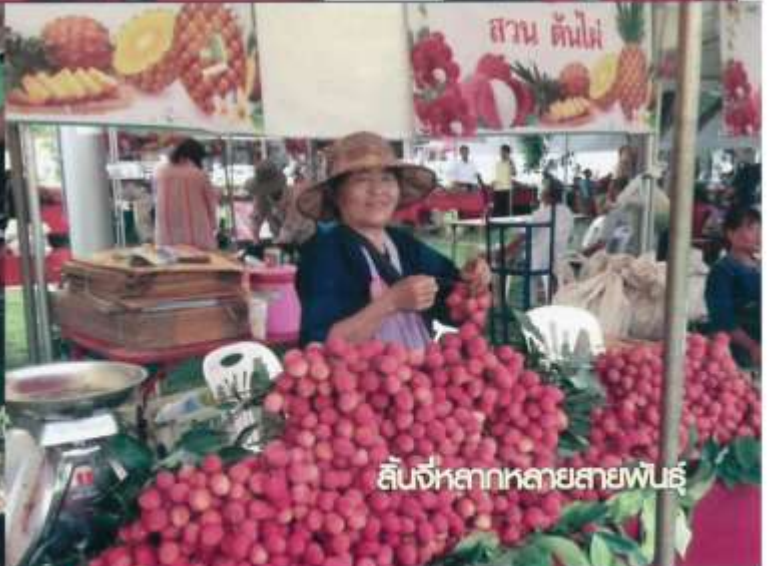
สินค้าหลากหลายสายพันธุ์