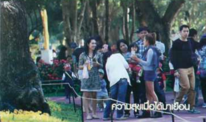
ความสุขเมื่อได้มาเยือน