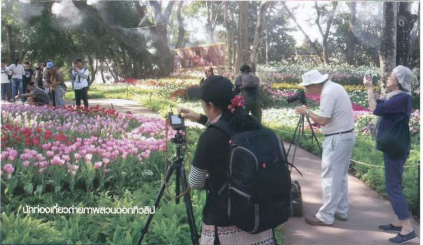
นักท่องเที่ยวถ่ายภาพสวนดอกทิวลิป