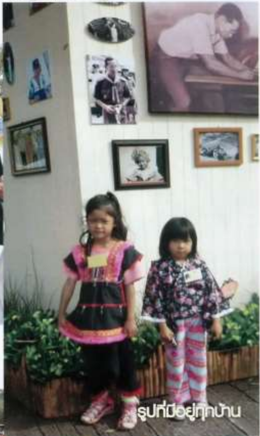
รูปที่มีอยู่ทุกบ้าน